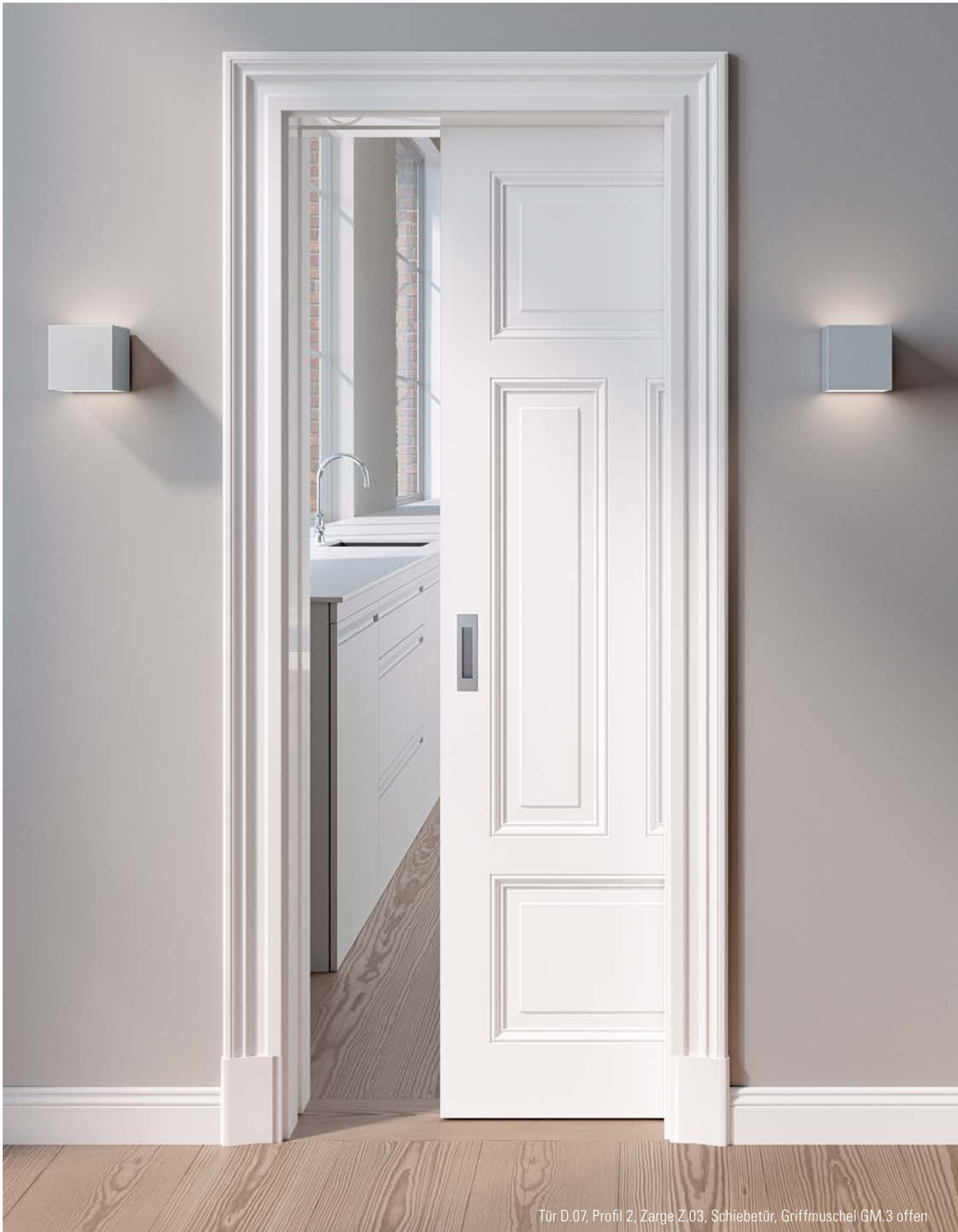
Tür D.07, Profil 2, Zarge Z.03, Schiebetür, Griffmuschel GM.3 offen