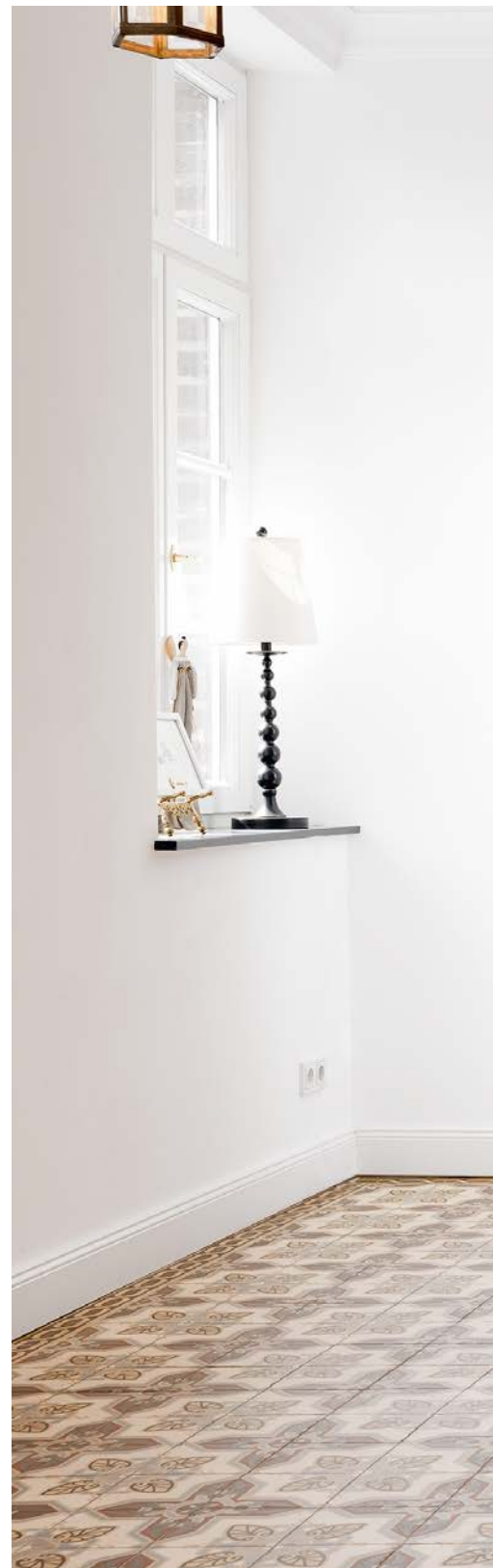
RESTAURIERTER VIERKANTHOF | Tür D.04, Profil 2, Zarge Z.02 und Sockel Z.02, Türhöhe bis 2,485 m