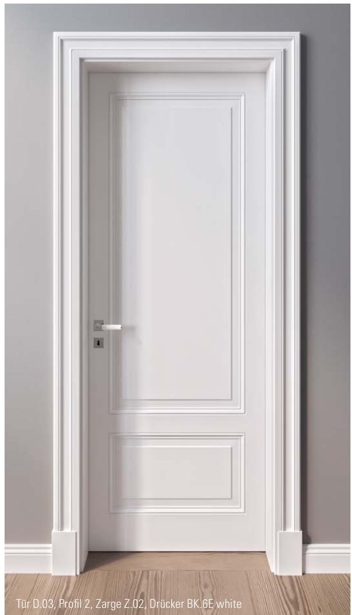
Tür D.03, Profil 2, Zarge Z.02, Drücker BK.6E white