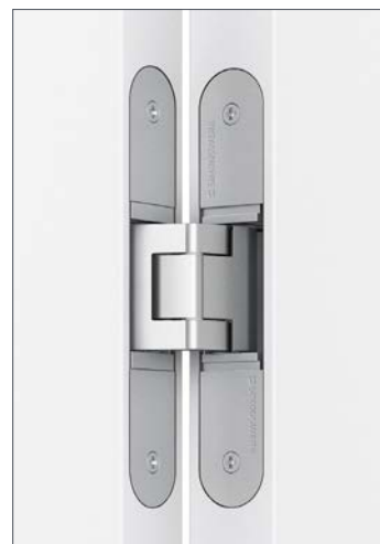
Beispiel: verdecktes Band – matt

Details für das Gesamtbild: Legen Sie Wert auf »SCHÖNES DAZU«