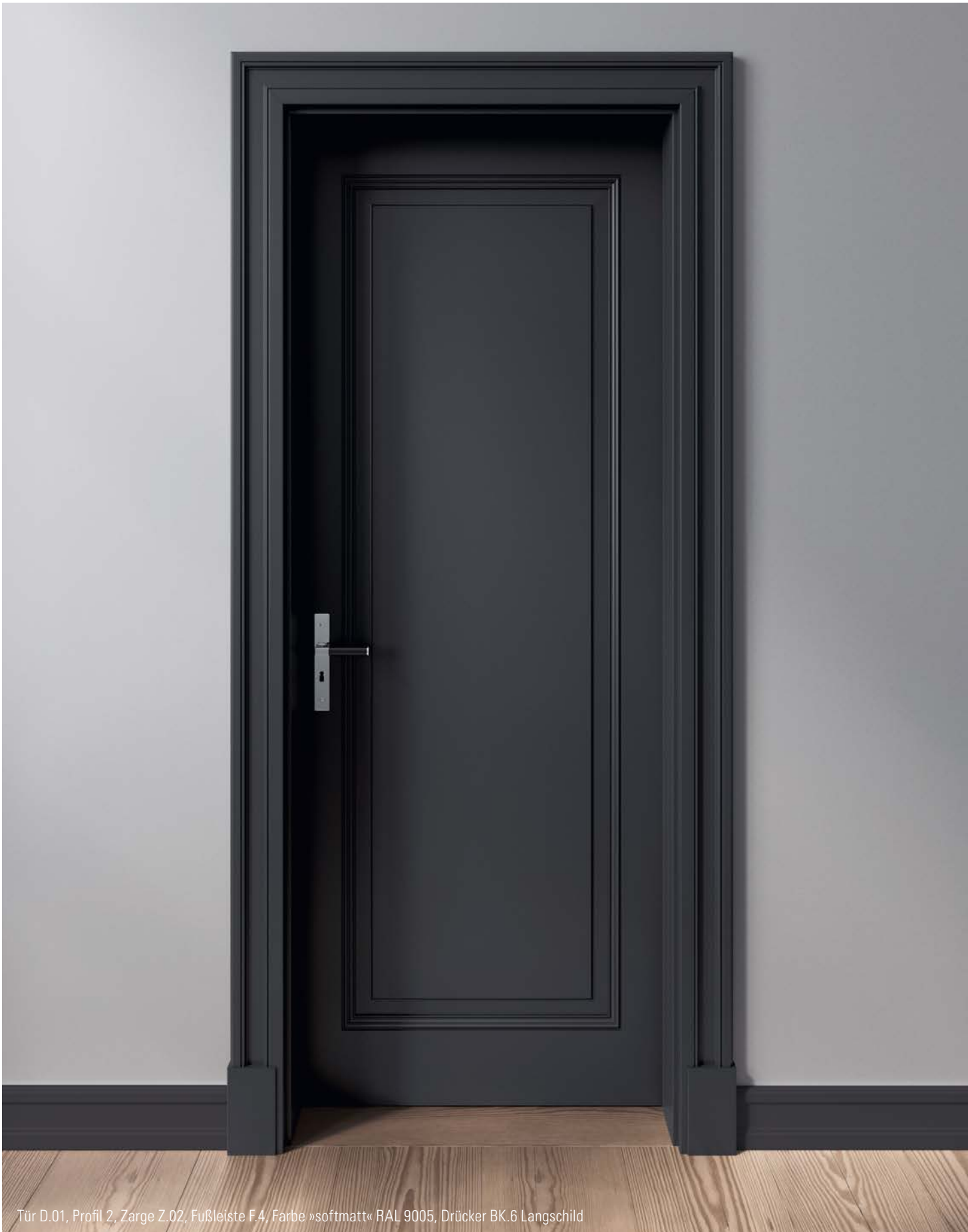
Tür D.01, Profil 2, Zarge Z.02, Fußleiste F.4, Farbe »softmatt« RAL 9005, Drücker BK.6 Langschild