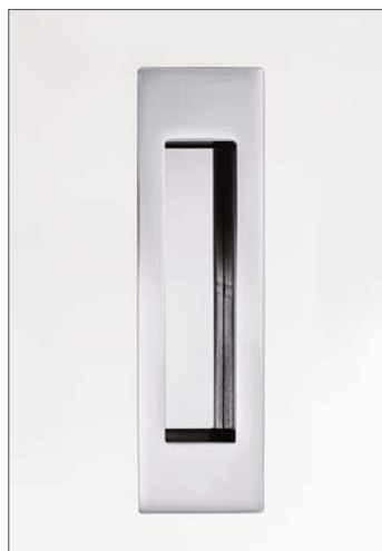
Beispiel: GM.3 offen, flächenbündig