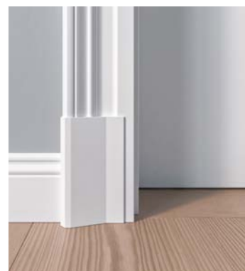
Sockel für Zarge Z.03

Details für das Gesamtbild: Legen Sie Wert auf »SCHÖNES DAZU«