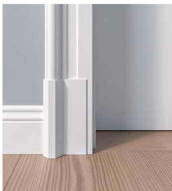
Sockel für Zarge Z.01

Dazugehörig, als optischer Schlusspunkt, die Sockelstücke, die an keiner handwerklich gearbeiteten Tür fehlen dürfen.