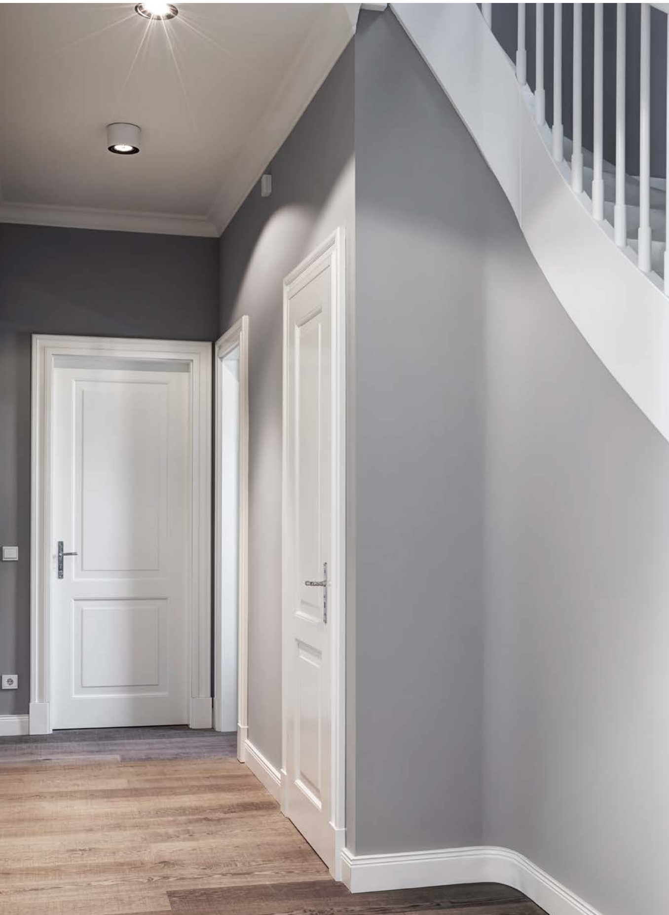
PRIVATHAUS BERLIN | Tür D.02, Profil 1, Zarge Z.02, stumpf, verdeckte Bänder