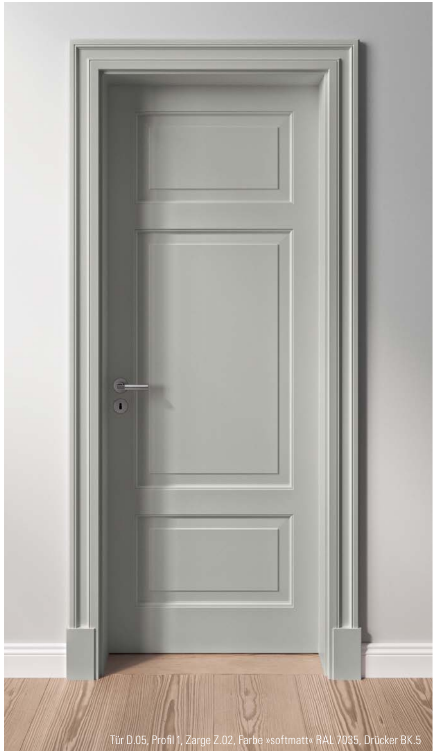
Tür D.05, Profil 1, Zarge Z.02, Farbe »softmatt« RAL 7035, Drücker BK.5

Dort wo es nötig ist und dort wo es möglich ist, sollte alte Bausubstanz erhalten werden – nicht nur im Denkmalschutz. Viele schöne Häuser warten auf schöne Türen. Die Anforderung von heute: Ein Raum darf vergangene Opulenz ausstrahlen, aber mit neuer Technik den baulichen Standard der Gegenwart erfüllen.