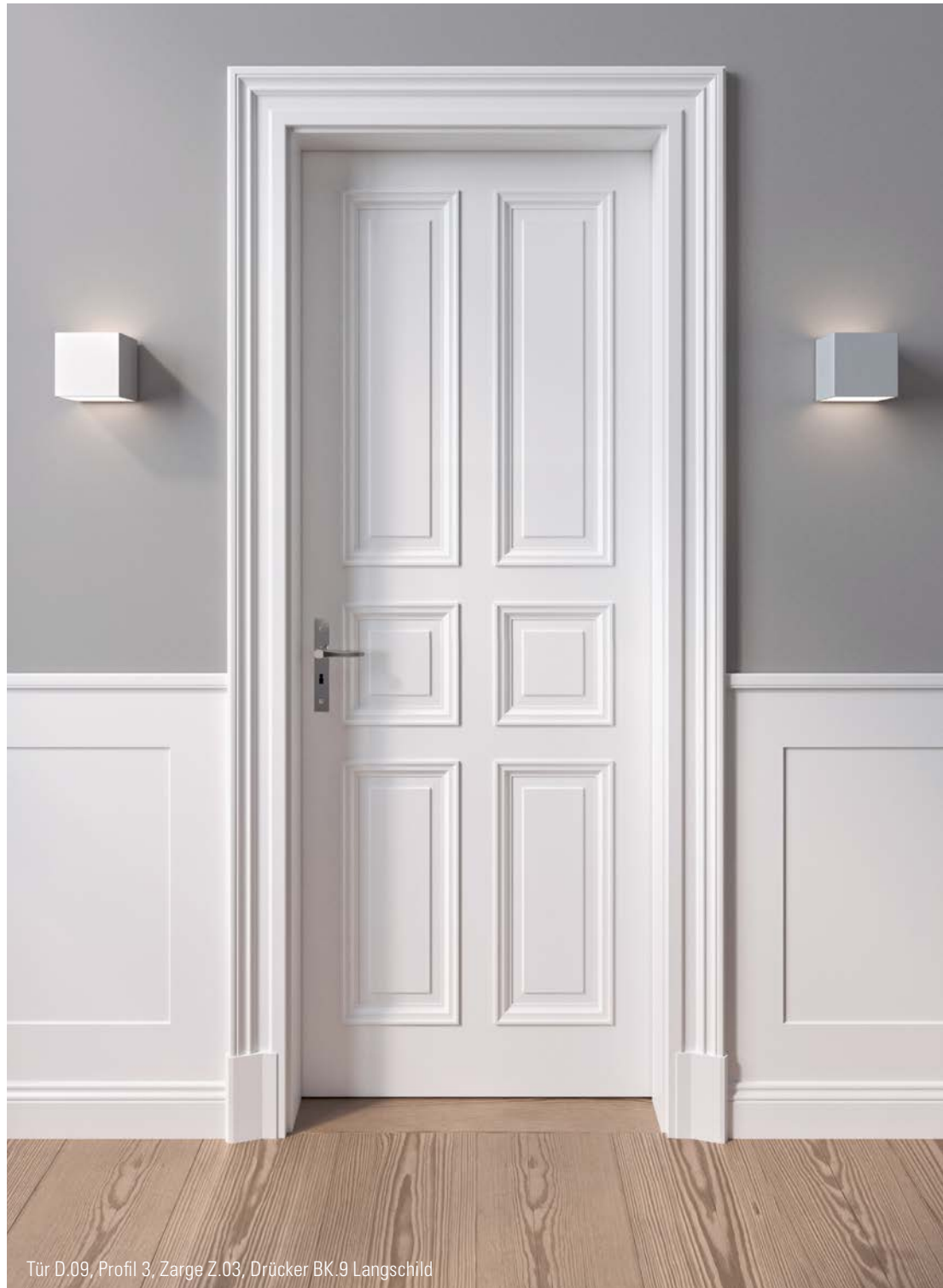
Tür D.09, Profil 3, Zarge Z.03, Drücker BK.9 Langschild

Die Türen als erstes Gestaltungsmittel bestimmen den Charakter eines Raumes. Die Aufteilung der Fläche mit der Anzahl der Felder gibt der Tür den Ausdruck und bestimmt die Persönlichkeit. Eine Übersicht aller Modelle zeigen wir auf den letzten Seiten.