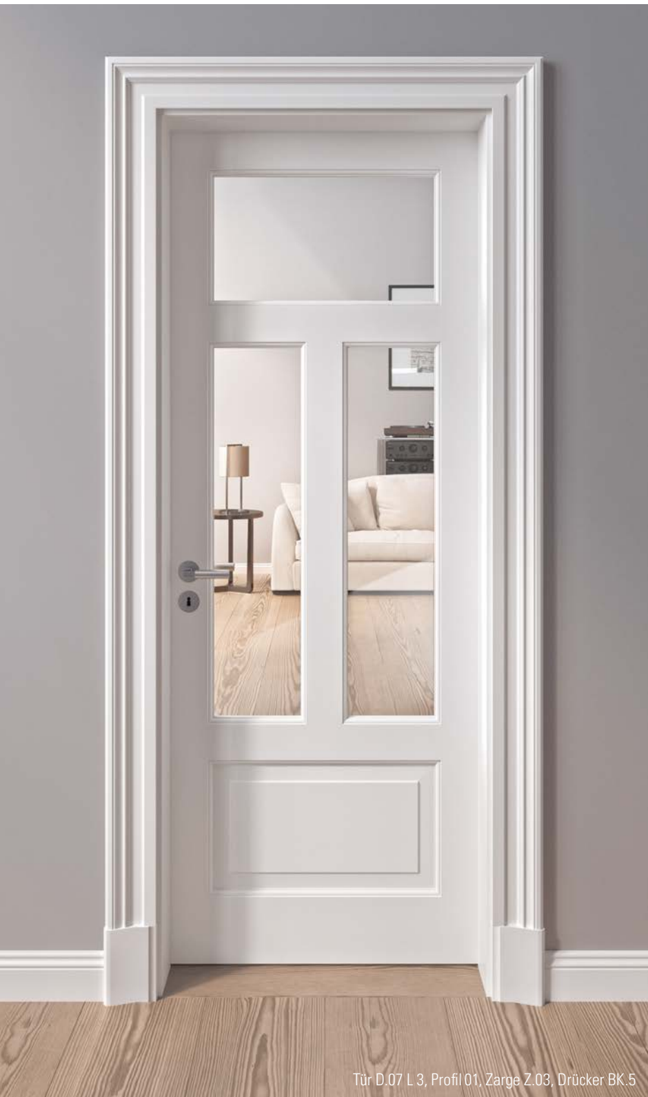
Tür D.07 L 3, Profil 01, Zarge Z.03, Drücker BK.5