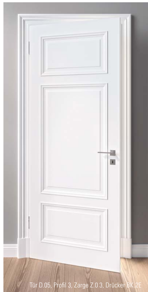
Tür D.05, Profil 3, Zarge Z.03, Drücker BK.2E