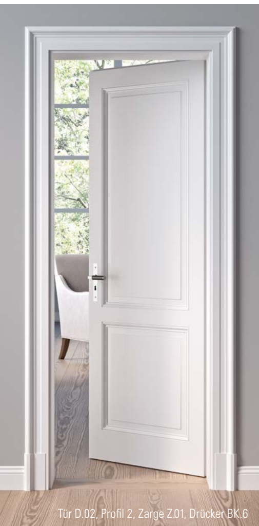
Tür D.02, Profil 2, Zarge Z.01, Drücker BK.6