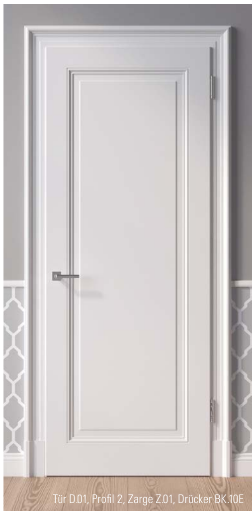
Tür D.01, Profil 2, Zarge Z.01, Drücker BK.10E