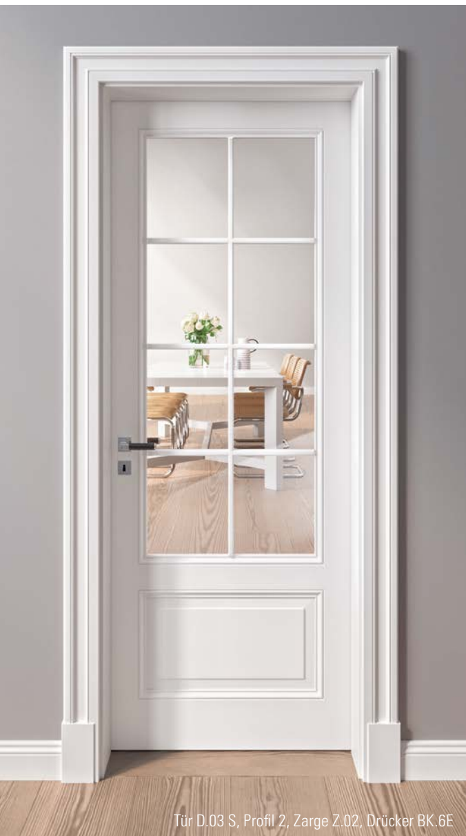
Tür D.03 S, Profil 2, Zarge Z.02, Drücker BK.6E

Mit Liebe zum Detail – Profile- rungen, stilvoll variiert – eine Reminiszenz an die Historie.