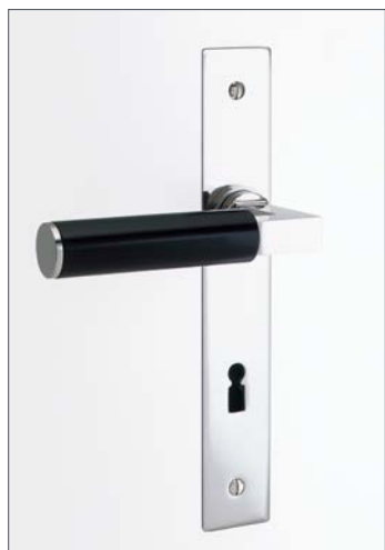
Beispiel: BK.6, Langschild, flächenbündig

D.01 S D.02 S D.03 S D.04 S D.05 S D.06 S D.07 S D.08 S D.09 S