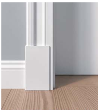
Sockel für Zarge Z.02